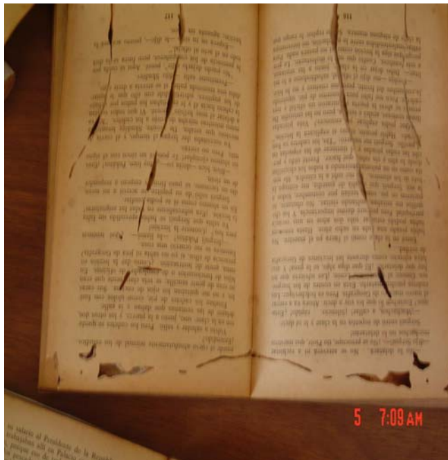
Libro dañado por la acción de insectos.

Fotos que muestran los diferentes tipos de deterioros presentes en la colección.