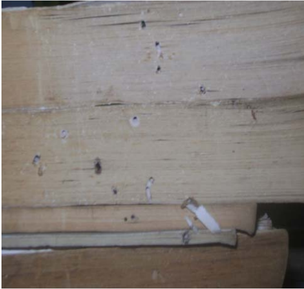
Documentos afectados por la acción de los insectos