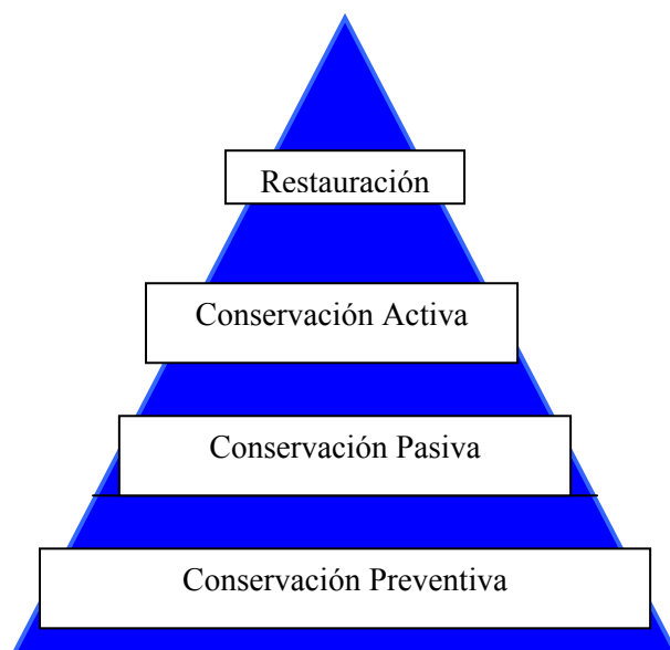
Fig.1. Pirámide de la Conservación

Solo para dar una idea de cómo mirar la conservación de otra manera, Steemers propone reflexionar acerca de la Pirámide de conservación