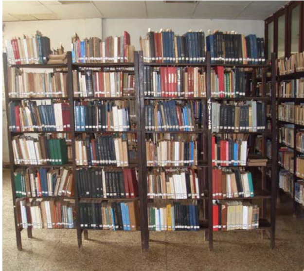
Hacinamiento en la colección