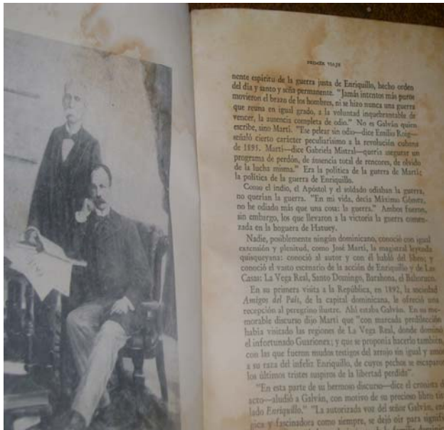
Documento afectado por la humedad