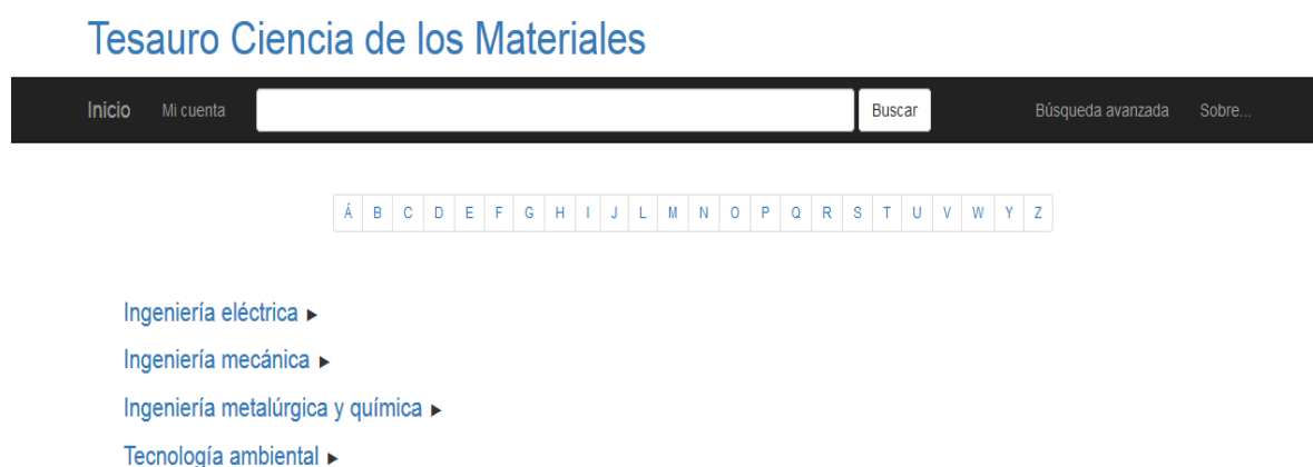
Fig. 1- Vista de la página inicial del tesoro en línea.

El tesoro está dirigido a estudiantes, profesores e investigadores de la comunidad universitaria de la Universidad de Moa Dr. Antonio Núñez Jiménez. Además de aquellas personas e instituciones interesadas en consultar dicha información. (ver figs. 1 a la 3)