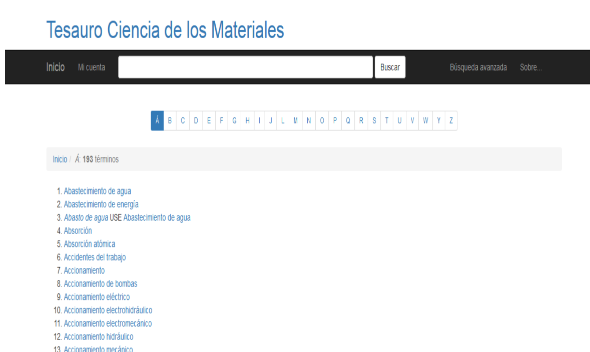
Fig. 3- Vista de la presentación alfabética del tesoro.